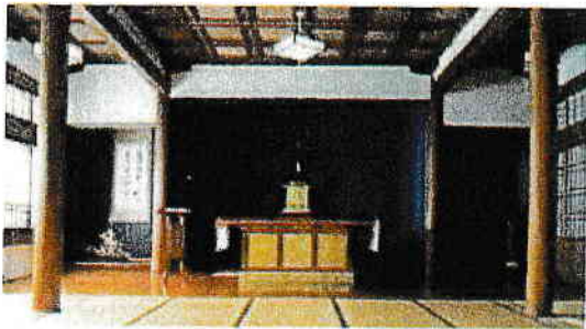
「あなたはわたしについてきなさい」(ヨハネ福音書)